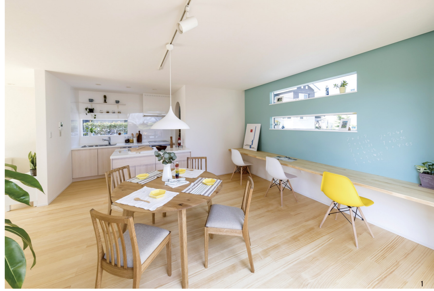
1. 家族がゆったりと過ごせる23帖超の広々としたLDK。キッチンからは料理をしながらダイニングやスタディースペースに居る子どもたちに目を配れるので、忙しいママも安心です 2. ダイニングと雁行に配置されたリビング。程よい仕切りがありながらも、お互いの気配が感じられます 3. ダイニングと繋がるウッドデッキはセカンドリビングとして大活躍。バーベキューやホームパーティーなど、楽しみ方は自由自在♪ (全て安城モデルハウス)

家族が集うLDKは23帖超の大空間。ダイニングと一体感のあるウッドデッキを入れると、30帖以上に!「ホロスホーム」では、それぞれの個室を小さくしてでも、家族団らんの場であるリビングを充実させるような提案しています。